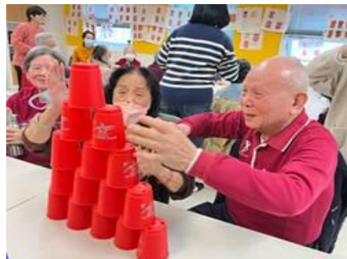
增進手臂協調性與穩定性