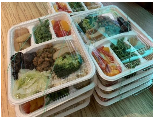
蔬食推廣日便當，蔬食減碳救地球