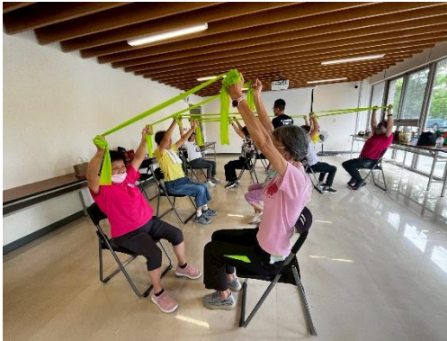
動齡體適能，健康又好玩