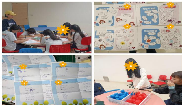
針對國中青少年，以自我認識、品學兼備、奔向卓越為主題，培養青少年有主動選擇與積極正向回應的能力

運用「我的豐格年代」品格教育課程，陪伴學生成為更好的自己。豐格，是豐盛和品格的結合。透過這個系列課程，幫助學生覺知希望讓自己更好，進而有能力好好規畫安排讀書時間。