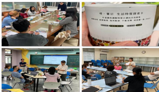
培訓書院導師培訓，貼近學生生活、引領學生，協助學生解決遇到的困惑

全體學生住宿的衛理女中，為發展住宿學校的特色，自 111 學年度起導入 13 世紀英國劍橋大學書院教育之精神。為達到豐富學生學習與住宿生活的目標，設置經專業訓練的書院導師，貼近學生生活、引領學生思考，協助學生解決遇到的困惑。使衛理學生在其青春年少的歲月中，因為有精緻的陪伴與輔導，建構更豐富的生命底蘊。