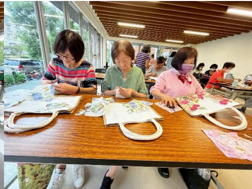
一起來做超級美的蝶古巴特包包