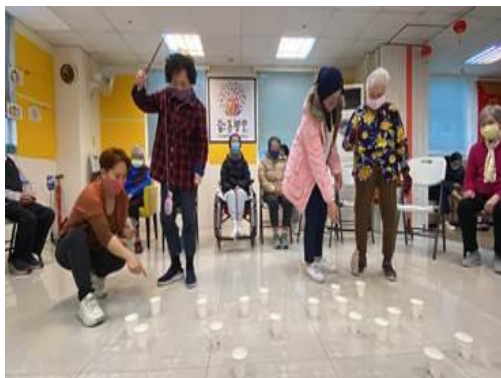
增進身體平衡及協調性