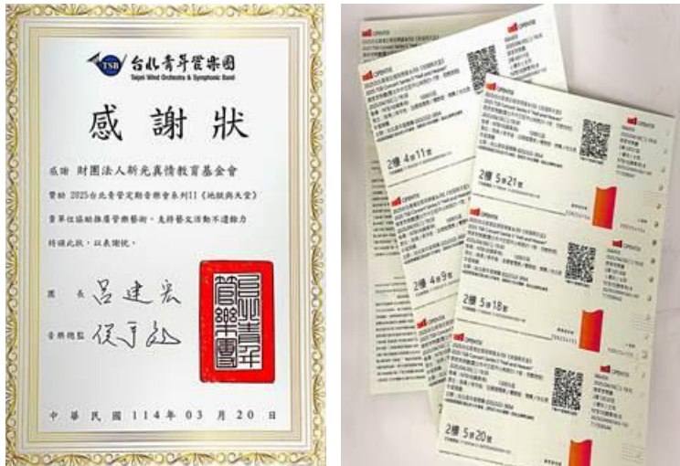
從地獄到天堂·體驗音樂旅程·用音樂描繪一場死後世界的精彩冒險