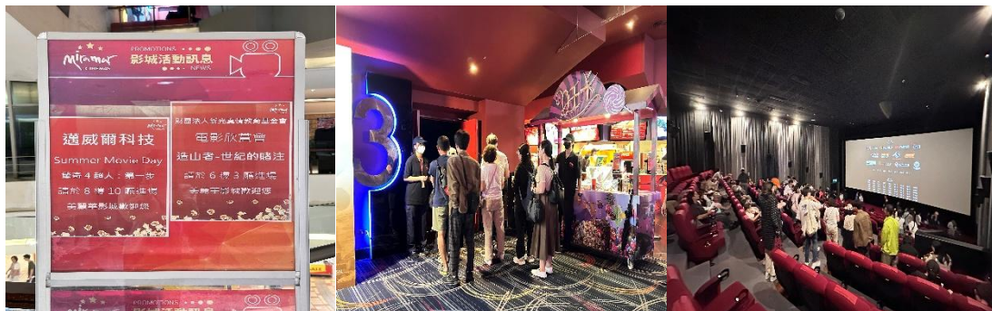
電影【造山者-世紀的賭注】，於美麗華影城欣賞影片，增進工作與生活平衡。